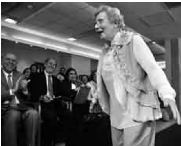
El desfile “Guapas”, con modelos de más de 80 años en la pasarela, en el centro residencial LAR.

bió enfrentar. “Sin saber nada tuve que estar capacitada para cuidar a mis padres durante muchos años. Hoy me doy cuenta del costo, tanto del tiempo como de la tarea dramática”, remarcó.