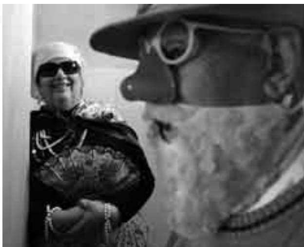
Participantes del taller de Envejecimiento Activo en el Centro Comunal Zonal 10 de José Belloni.

Por otra parte, la implementación del Sistema Nacional de Cuidados ya prevé un plan piloto en los departamentos de Paysandú, Rocha y Montevideo, que apunta a abarcar situaciones como las que, al igual que muchos, Turino de-