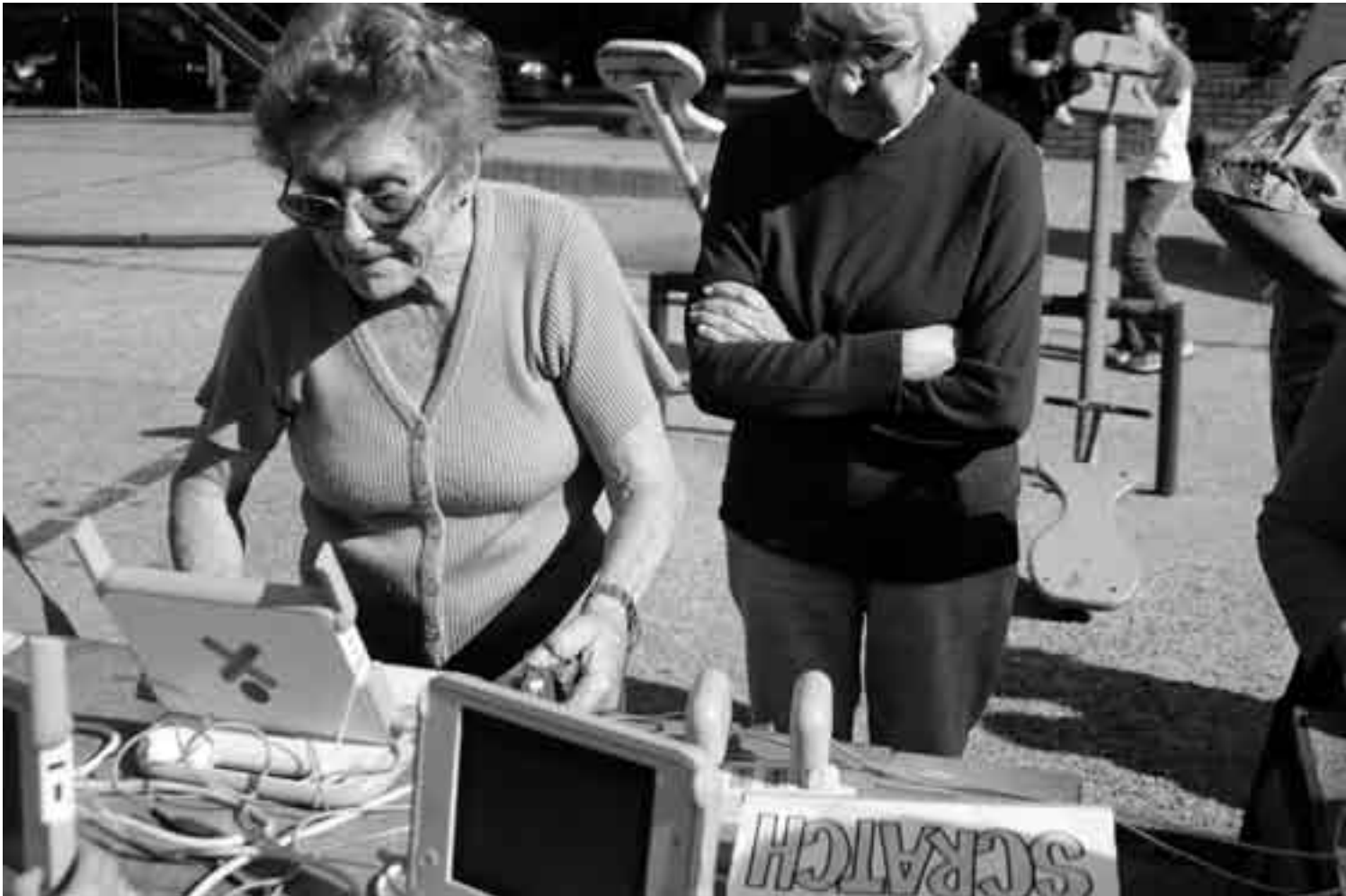
Jornada de prueba de las XO del Plan Ceibal en el zoológico de Montevideo.