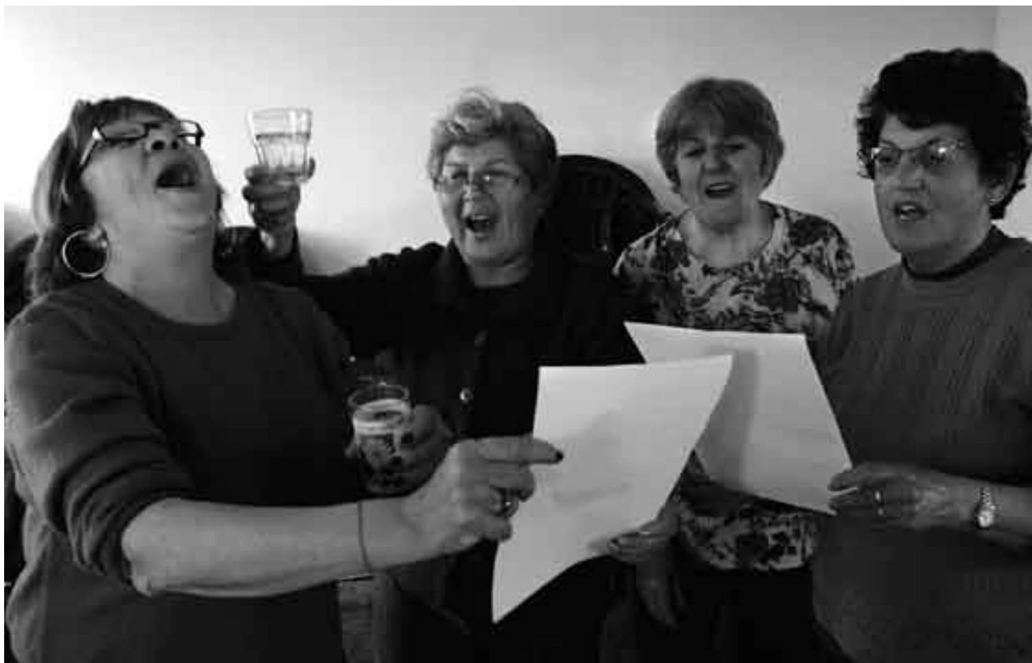
Participantes del taller de Envejecimiento Activo en el Centro Comunal Zonal 10 de José Belloni.

Tanto las residentes que modelaron como las diseñadoras destacaron aspectos positivos de la experiencia, si bien de las últimas sólo una se mostró algo inclinada a continuar trabajando en líneas de ropa para la tercera edad. Consultado sobre la consigna que invitaba al desfile -"demostrando que la belleza no tiene edad"-, el psicólogo Berriel expresó que no cree que eso desmitifique la cuestión de la vejez, ya que "no es sobre la pasarela donde la vejez tiene que recuperar su dignidad".