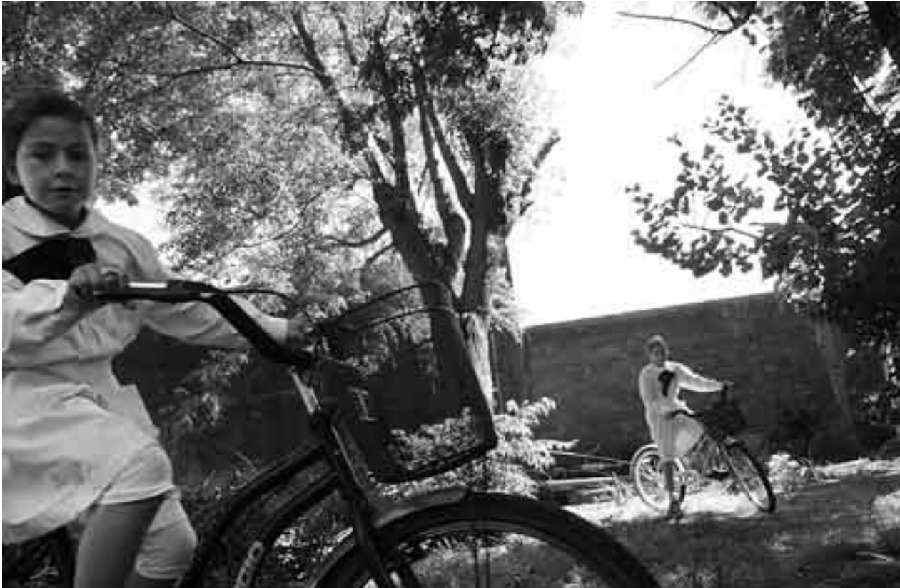
Niños que participan en el programa El futuro llegó hace rato, de la radio comunitaria Radiolugares de Carmelo, departamento de Colonia.