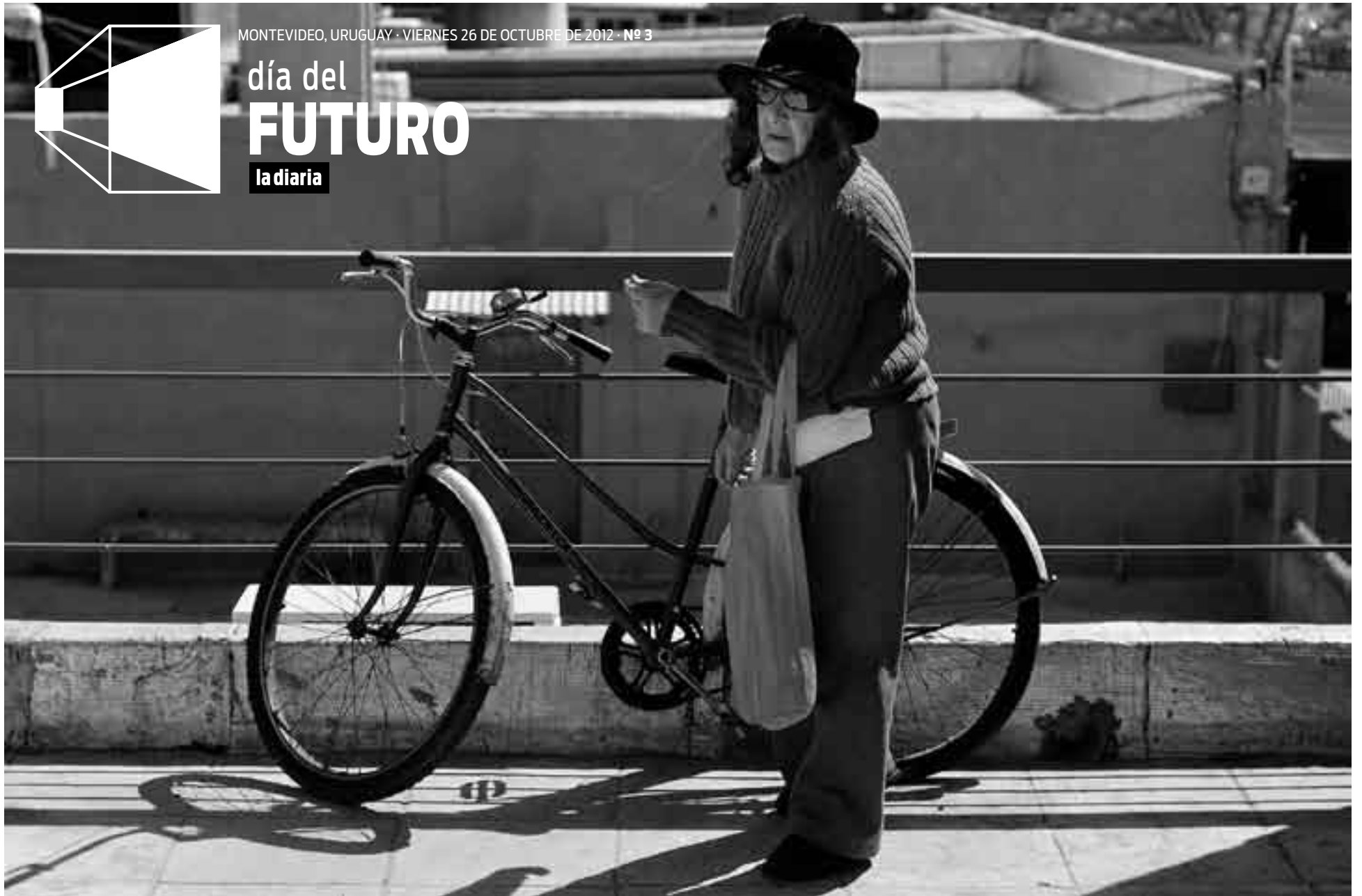
Participante del taller de Envejecimiento Activo en el Centro Comunal Zonal 10 de José Belloni, esquina Capitán Tula.