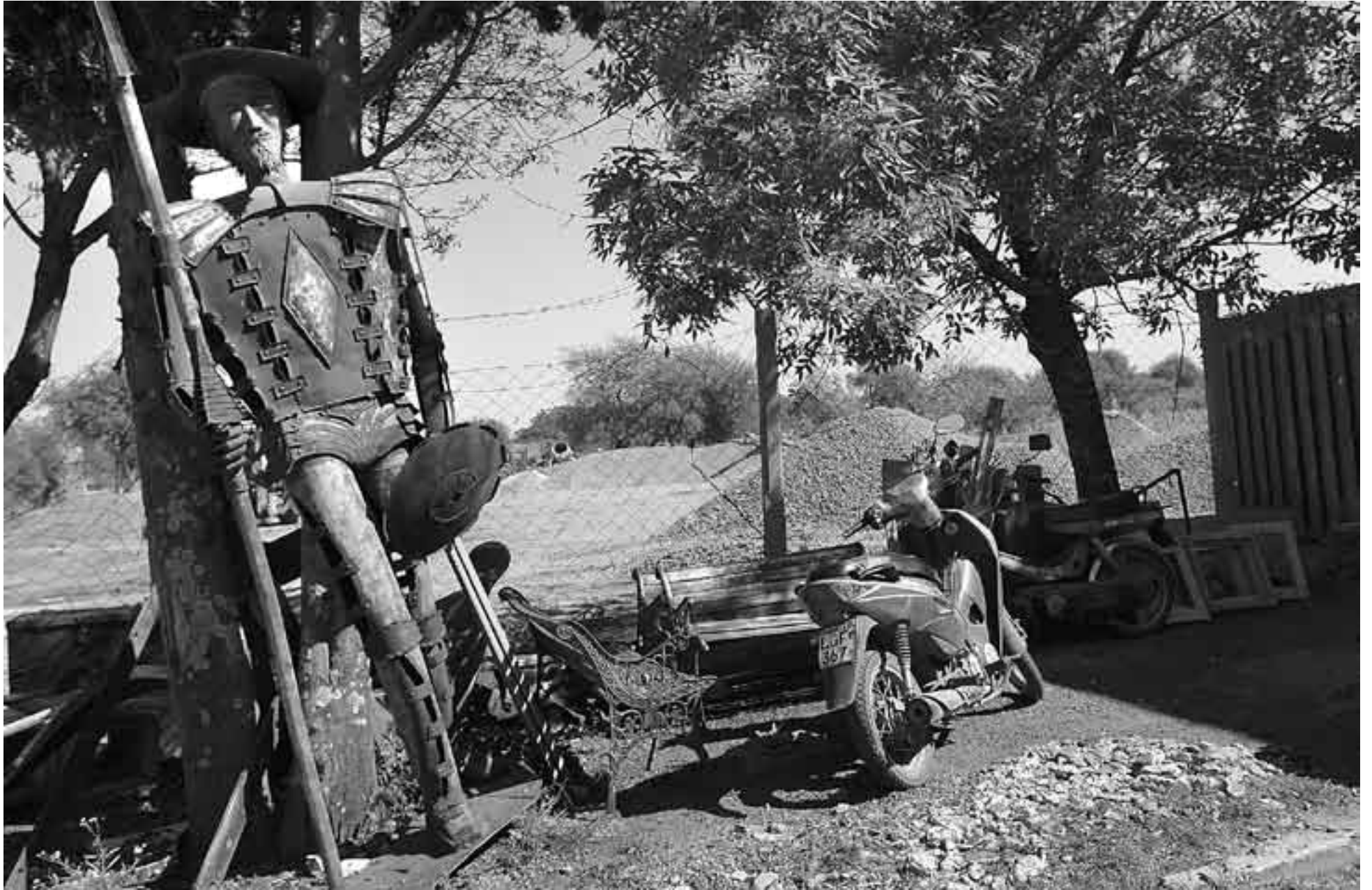
Escultura del Quijote en el corralón municipal de Nueva Palmira.