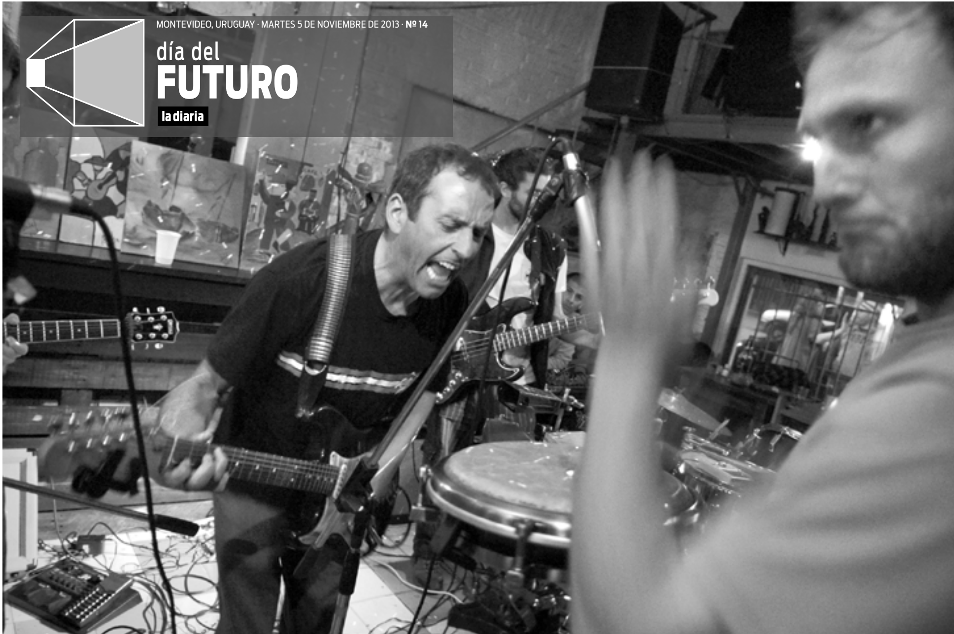
Concierto de la banda Maisterra y los Tsunami Riders, el sábado, en Garuffa's Bar.