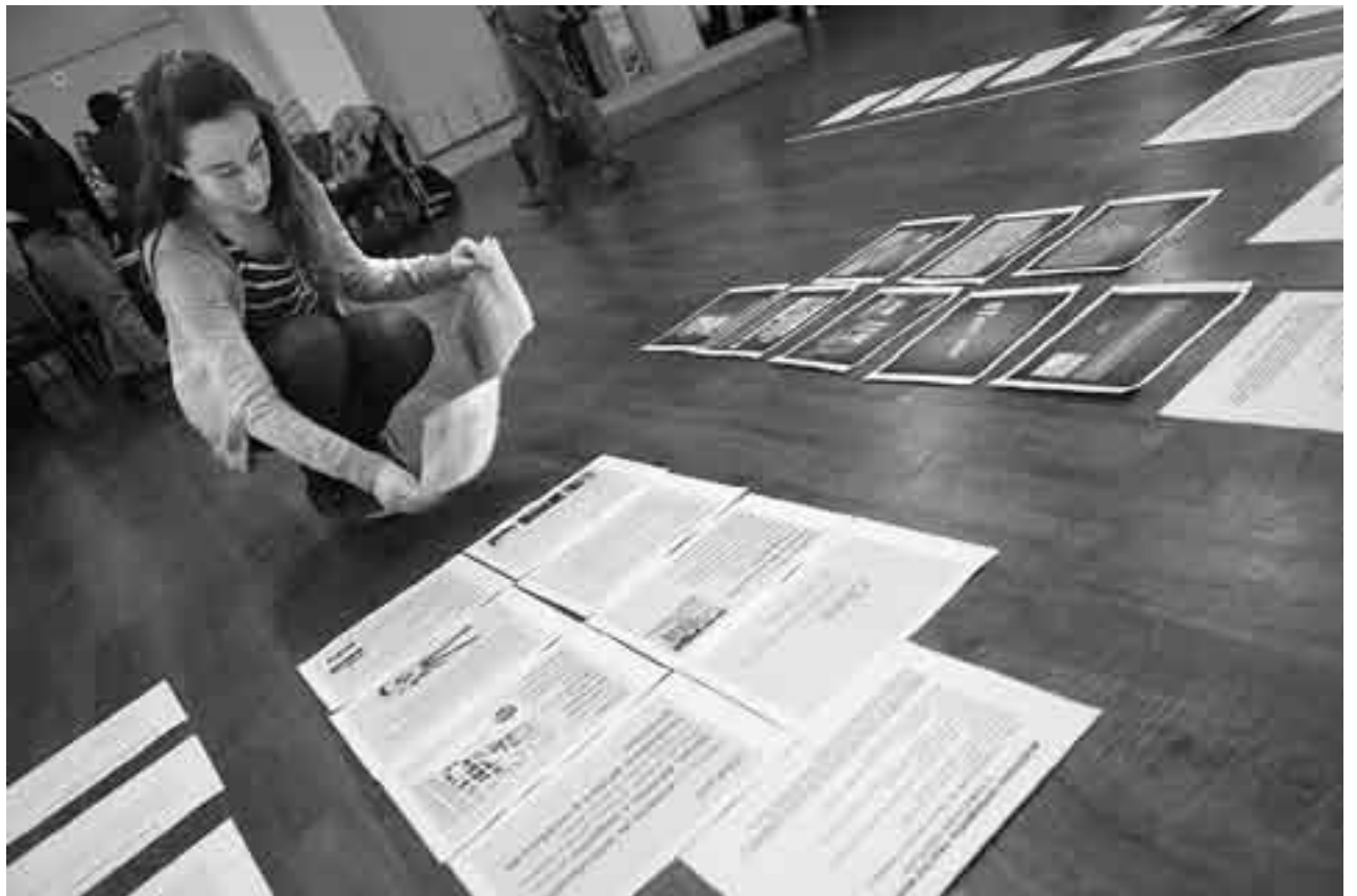
Taller del Barrio de las Artes en el Hotel Esplendor.

El proyecto Comité Base Barrio de las Artes (Cbar), sea cafetería o materia, pretende constituirse como un espacio de “articulación, difusión e impulso de ideas artísticas, sociales y creativas” apostando al arte como vehículo de fortalecimiento de vínculos sociales. La convocatoria está abierta a todas las personas, artistas o no, para que aporten ideas, y el Cbar en sí mismo o por