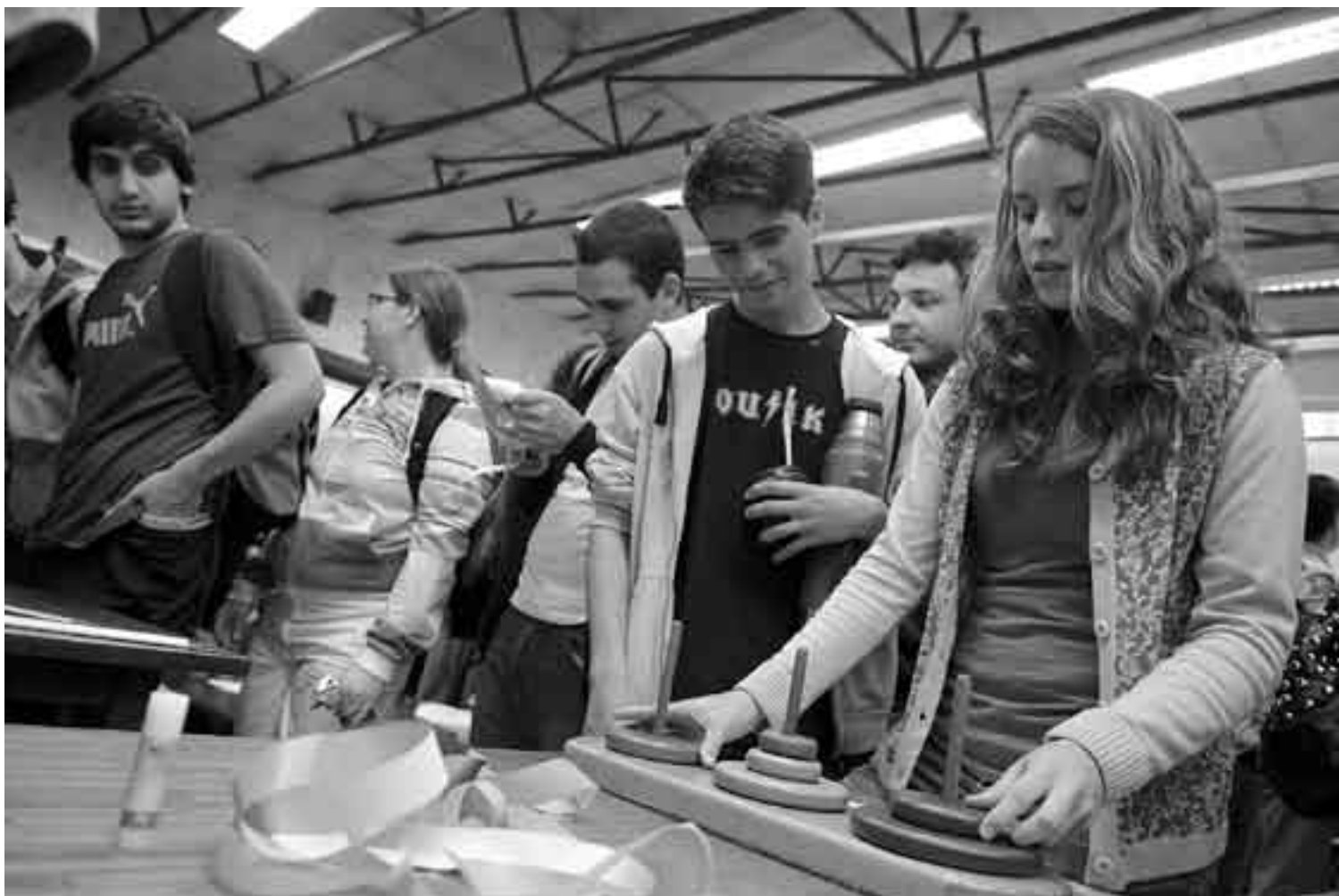
Ingeniería de Muestra, el viernes, en la Facultad de Ingeniería.

En esta línea, Schultze considera que todavía no se ha podido instaurar el DDF como marca, que era uno de los objetivos del año pasado. "Hay que explicar mucho, somos una empresa pequeña, poco conocida todavía", afirmó. Para el docente, la necesidad de innovar está siempre presente en los integrantes del GT, pero considera que también es difícil materializarlo.