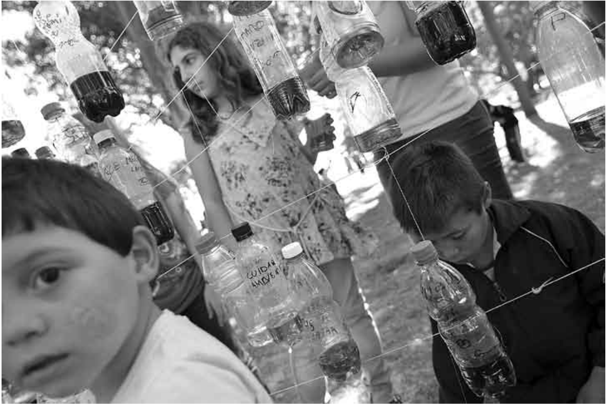
Oleada Lúdica, el sábado en el Parque Rodó.