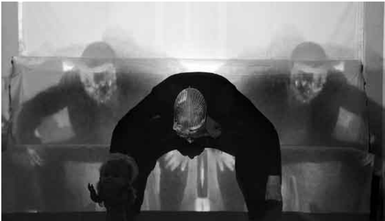
Performance Flights 1976-vuelos de la muerte, durante la muestra colectiva de diseño y arte de la revista Wop!, el viernes en Café La Diaria.